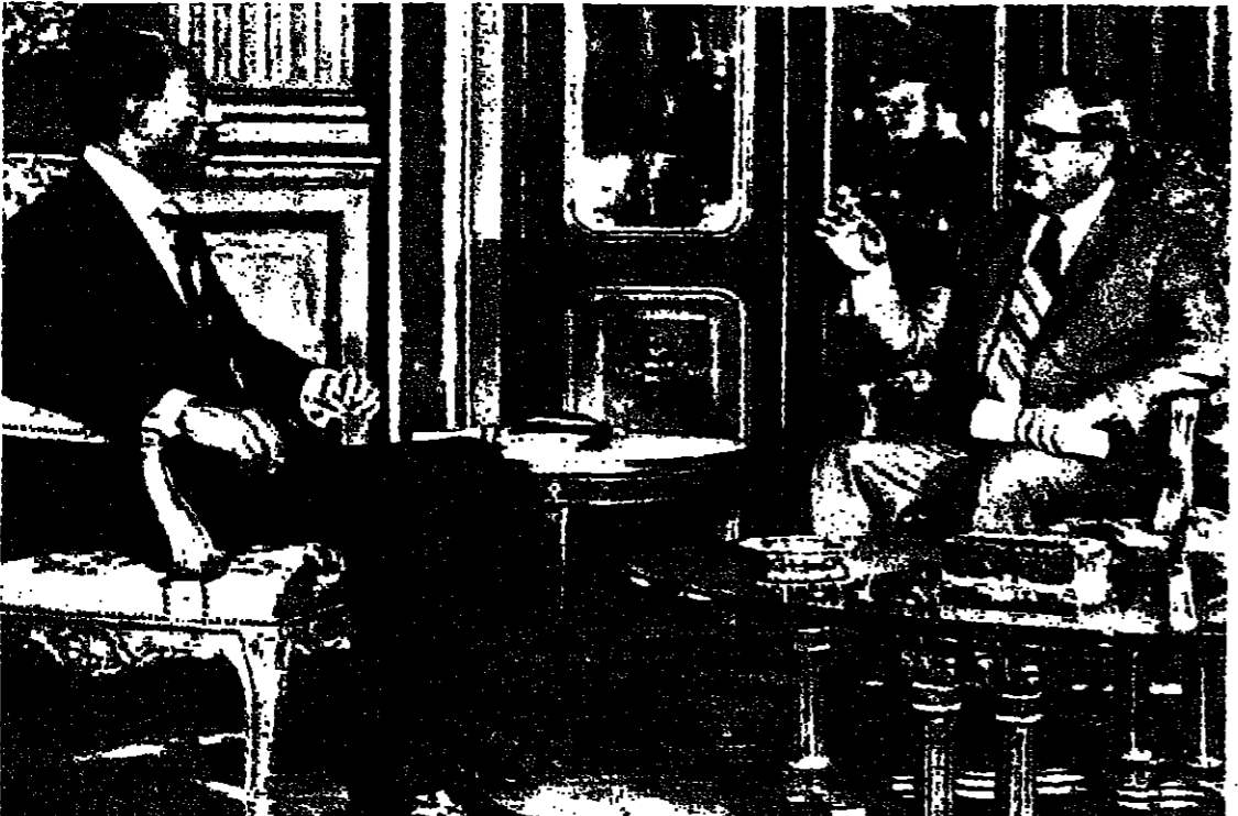
رئيس الدولة السيد اسحق ناقون يبدأ أول جولة له من المحادثات مع الرئيس المصري محمد أنور السادات التي تركزت على تطبيع العلاقات المصرية - الإسرائيلية .